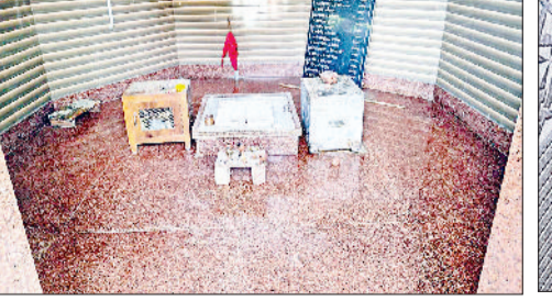
मंडी अटेली। हरनाम गिरी मंदिर में टूटा हुआ दान पात्र व मंदिर परिसर में संदिग्ध व्यक्ति कंबल ओढ़े हुए।

अटेली क्षेत्र के गांव सागरपुर स्थित हरनाम गिरी मंदिर में बीती रात्रि चोरी की वारदात को चोरों ने अंजाम दिया। चोर ने मंदिर में रखे दानपात्र का ताला तोड़कर उसमें से हजारों रुपये की नकदी चुरा ली और मौके से फरार हो गया। जानकारी के अनुसार सोमवार दोपहर करीब 12 बजे जब गांव के कुछ युवक मंदिर में पहुंचे तो उन्होंने दानपात्र का ताला टूटा हुआ देखा। दानपात्र खुला पड़ा था और उसमें रखी नकदी गायब थी। इसके बाद युवकों ने तुरंत डायल 112 पर पुलिस को सूचना दी। घटना की खबर गांव में फैलते ही मंदिर परिसर में ग्रामीणों की भीड़ जुट गई और लोगों में रोष देखने को मिला। मौके पर पहुंचकर पुलिस से जांच शुरू की। मंदिर में लगे सीसीटीवी कैमरों की फुटेज खंगलने पर एक संदिग्ध व्यक्ति कंबल ओढ़े हुए नजर आया। हालांकि चोर ने अपनी पहचान छिपाने के लिए पहले ही मंदिर