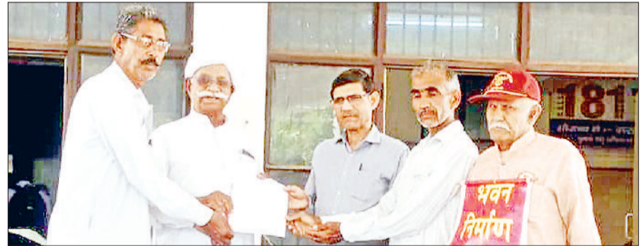
नारनौल। सचिवालय परिसर में ज्ञापन सौंपते हुए।

भवन निर्माण कारीगर मजदूर यूनियन ने एसडीएम के मार्फत प्रदेश के श्रम मंत्री को ज्ञापन भेजकर मांग की है कि पंजीकरण पोर्टल को खोला जाए। उन्होंने मांग की कि मजदूरों का पंजीकरण की प्रक्रिया को सरल किया जाए, पंजीकरण ऑफलाइन ऑनलाइन दोनों तरीकों से किया जाए, पंजीकरण में 90 दिन की अनवाश्यक शर्तों को हटाया जाए, चार लेबर कोड निरस्त किए जाएं, फैमिली आईडी की शर्त को हटाया जाए, मनरेगा मजदूरों को साल में 200 दिन काम और 800 प्रतिदिन बिहारी दी जाए, सभी कारीगर मजदूरों को गांव में 100-100 गज के