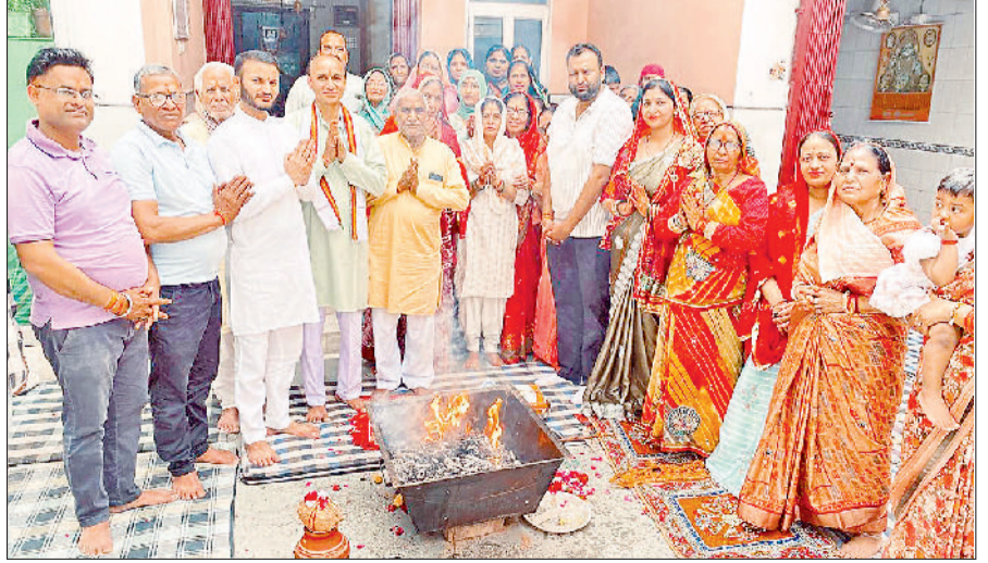
महेंद्रगढ़। मंदिर में आयोजित हवन में आहुति पर अर्चना करते हुए।

होता है तथा सकारात्मक ऊर्जा का संचार होता है। इससे मन को शांति मिलती है और व्यक्ति के जीवन में सुख-समृद्धि आती है। मंदिर प्रभारी