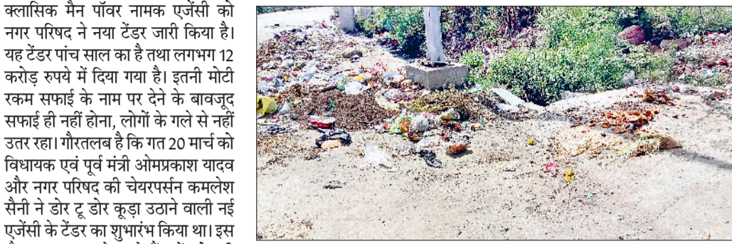
नारनौल। सीआइए रोड अंडरपास के पास पड़ी गंदगी।

जमीनी हकीकत इन दावों के बिल्कुल विपरीत नजर आ रही है। शहर के अधिकांश वार्डों में सफाई व्यवस्था बंद कर दी गई है। कई जगहों पर डोर टूटने से कूड़ा उठाने वाली गाड़ियां पहुंच ही नहीं रहीं हैं। ऐसे में लोग मजबूरी में घरों का