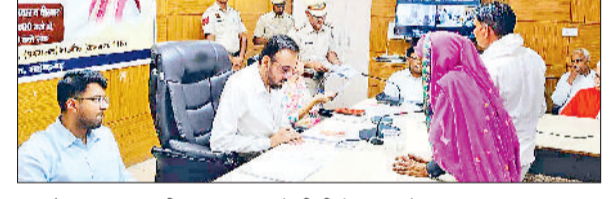
नारनौल। आमजन की समस्याएं सुनते डीसी कैप्टन मनोज कुमार।

उपायुक्त कैप्टन मनोज कुमार ने कहा कि सरकार व जिला प्रशासन का एकमात्र लक्ष्य जन सेवा है और इसके लिए हम सब 24 घंटे तत्पर हैं। इसी उद्देश्य की पूर्ति के लिए जिले में लगातार समाधान शिविर आयोजित किए जा रहे हैं। डीसी सोमवार को लघु सचिवालय के मीटिंग हॉल में आयोजित जन समाधान शिविर के बाद उपस्थित अधिकारियों को संबोधित कर रहे थे। इस शिविर के दौरान कुल 82 नागरिकों की समस्याओं को सचत विभागों को त्वरित कार्रवाई के निर्देश दिए। अधिकारियों को संबोधित करते हुए उपायुक्त ने स्पष्ट किया कि प्रशासन के सभी अंग एक